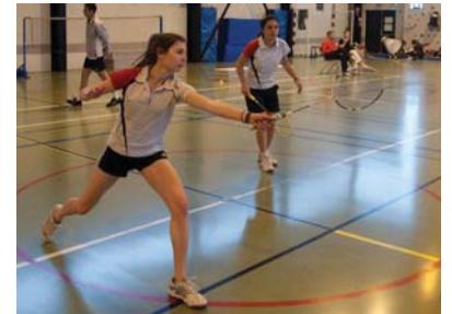
Beauvais - 2012