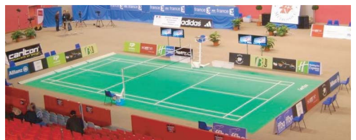
Coliséum - 2011