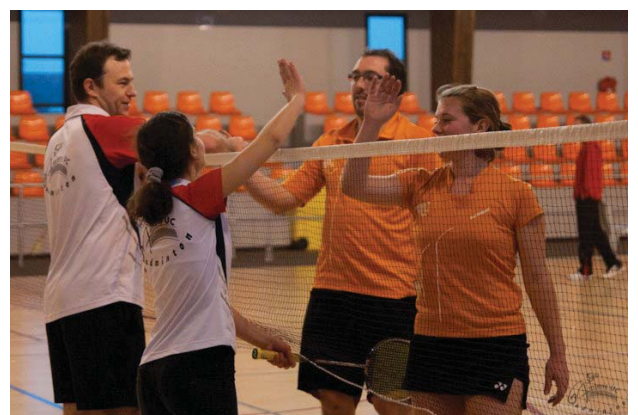
Margny-Les-Compiègne - 2012

Jeunes, adultes, hommes, femmes, loisirs et compétiteurs, toutes et tous cohabitent au sein du club pour former un ensemble homogène et équilibré. Notre association doit s'adapter à un environnement en constante évolution, mais notre ambition est de conserver cette relation de symbiose vitale pour notre club ainsi que cet état d'esprit et cette convivialité qu'on su créer nos prédécesseurs.