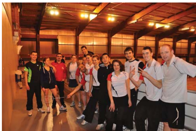
Margny-Les-Compiègne - Doublotline - 2012

[Offre partenaires détaillée en annexe du dossier]