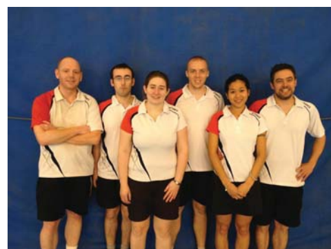
L'équipe de Départementale 1 - 2012

L'AUC monte en Nationale 3 et compte aujourd'hui cinq équipes mixtes : trois au niveau départemental et deux en régional. L'une de ces deux équipes est aujourd'hui à la porte du niveau National (N3) et promet une belle saison 2012-2013 au club. Les quatre autres équipes sont également en bonne voie pour suivre la progression de l'équipe première.