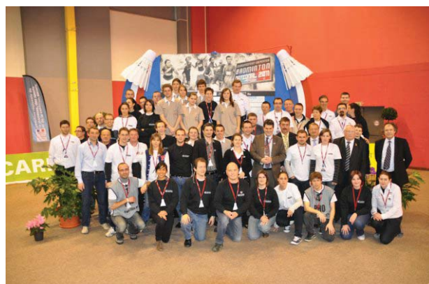
Coliséum - 2011